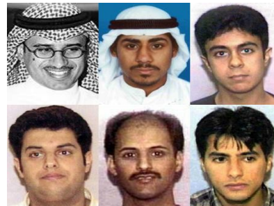
Även BBC har rapporterat om flera kapare som hittats vid liv.

En tankesmedja med förkortningen PNAC, varav flera medlemmar tillhör den nuvarande administrationen, förordade en massiv utbyggnad av militären. I ett dokument som skrevs av PNAC (Rebuilding Americas Defenses) i september 2000, ett år innan terroristattacker, skrev de att denna massiva utbyggnad av militären skulle gå långsamt om inte en katastrofisk och katalyserande händelse skulle inträffa – som ett nytt Pearl Harbor. Denna händelse inträffade och militären fick 100 miljarder dollar i ökad budget årligen efter den 11:e september 2001.